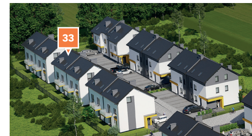
Widok osiedla z lotu ptaka